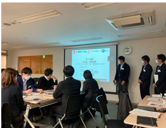
(2) チーム・個人発表