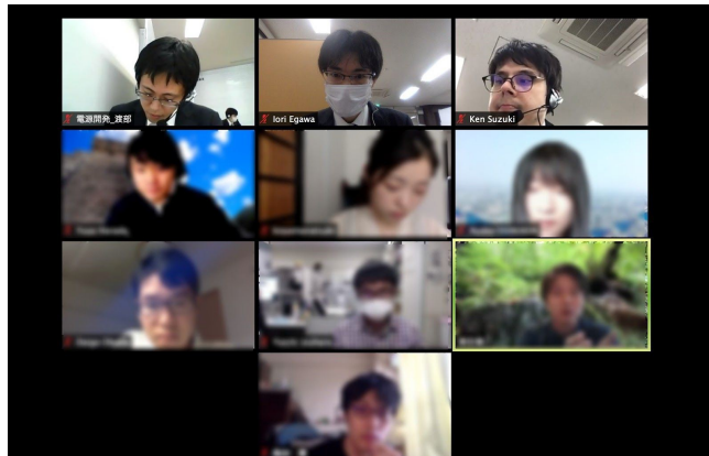
第2部 グループディスカッション