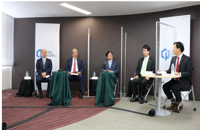
第1部 パネルディスカッション